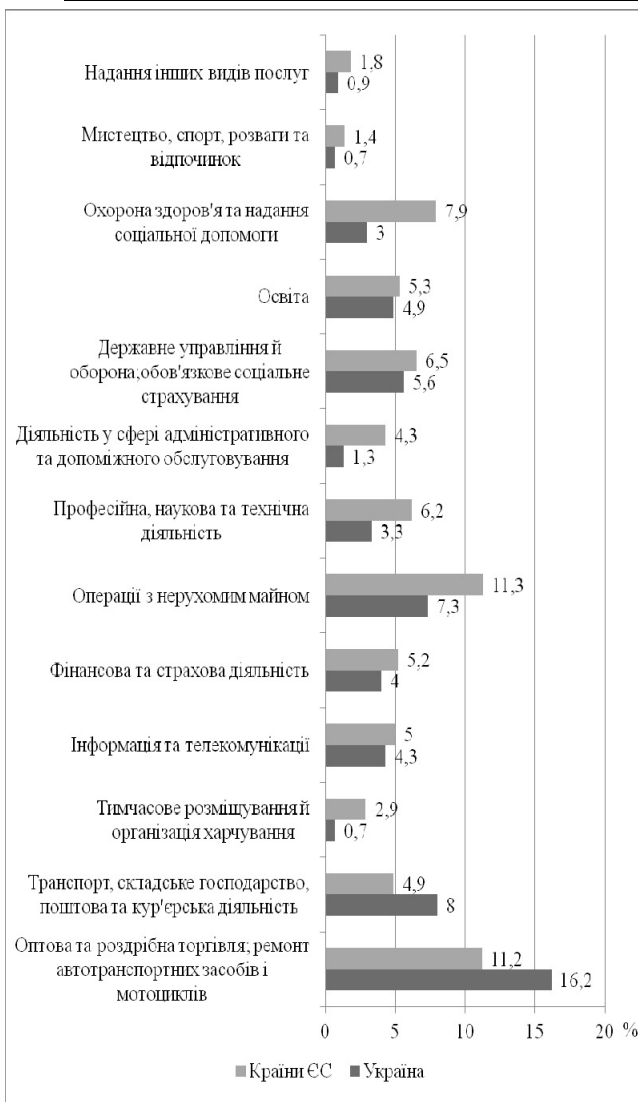
Рис. 1. Порівняння часток сфери послуг у ВВП України та країн ЄС [складено авторами за [3, 4]]

Так, на водному транспорті експорт перевищує імпорт у 4,9; повітряному – 2,5; залізничному – 2,16; автомобільному – 2,1; трубопровідному – 30,1 рази [3]. Значне позитивне експортно-імпортне сальдо свідчить про недостатній обсяг надання послуг в Україні, що має місце з причини невідповідності ціни якості та низької платоспроможності населення. За дослідженнями фахівців Світового банку одним зі значних факторів, що впливають на обсяги та ефективність сфери послуг, є регуляторна політика держави. Зменшення регуляторного тиску у країнах ЄС на підприємства сфери послуг покращило ефективність останніх на 3,8 % [6]. Так, тільки затверджений відповідною постановою Кабінету Міністрів Україні перелік органів, що здійснюють ліцензування підприємницької діяльності в Україні, налічує 26 складових, що в умовах високого рівня корупції створює перешкоди для розвитку сфери послуг. Здійснення в Україні аналогічних європейським заходів повинно позитивно вплинути на обсяги та структуру послуг, що надаються.