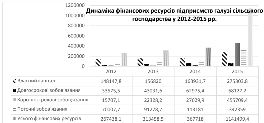
Рис. 2. Динаміка фінансових ресурсів підприємств галузі сільського господарства у 2012-2015 рр. [9]

Дані рис. 3 висвітлюють чітку тенденцію до значного зросту поточних зобов'язань у порівнянні з досить повільним зростом довгострокових зобов'язань. Це є негативною тенденцією, адже залучення саме довгострокових ресурсів, за умови ефективного їх використання, дозволяє досягнути значні позитивні економічні зсуви, у тому числі, у напрямку покращення фінансових результатів сільськогосподарських підприємств.