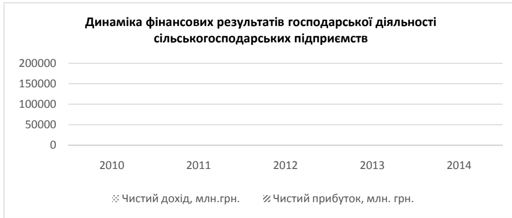
Рис. 1. Динаміка фінансових результатів господарської діяльності сільськогосподарських підприємств [9]

Обсяг забезпечення фінансовими ресурсами сільськогосподарських підприємств на протязі 2012–2015 рр. демонструє стабільне зростання – на 874061,3 млн. грн. У 2015 р. спостерігається суттєвий приріст короткострокових та поточних зобов'язань у порівнянні з досить незначним приростом довгострокових зобов'язань, що не можна віднести до позитивної тенденції.