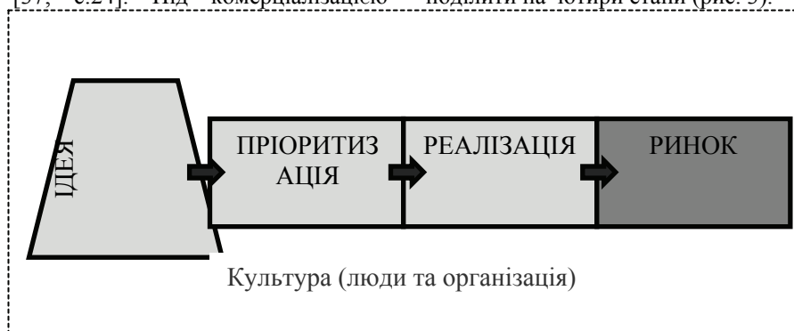
Рис. 2. Процес комерціалізації результатів НДДКР [розроблено автором]

Процес комерціалізації результатів НДДКР (на прикладі ВНЗ Великобританії) умовно можна поділити на чотири етапи (рис. 3).