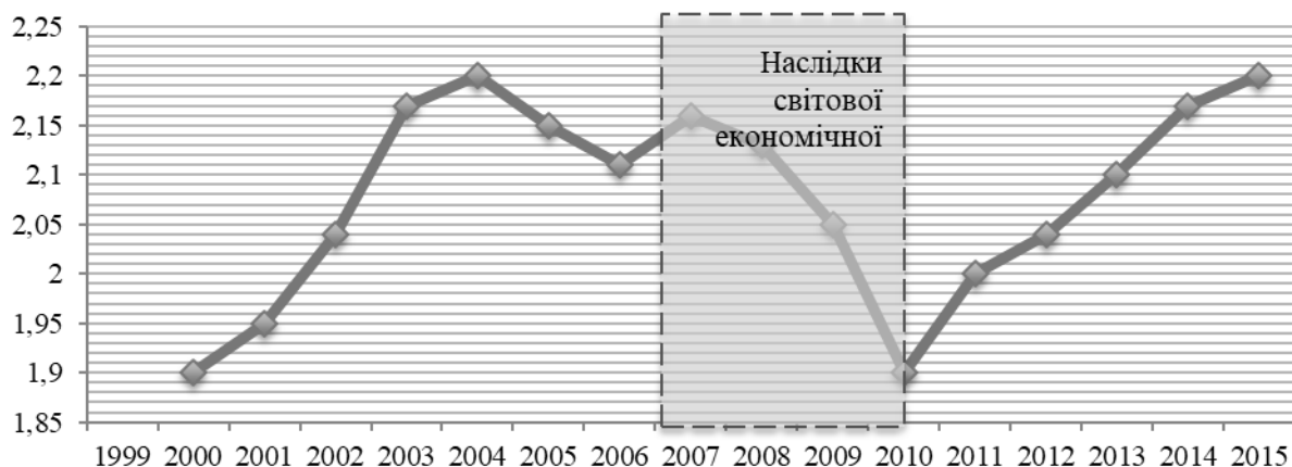
Рис. 3. Динаміка індексу міграційної привабливості країн ЄС [складено автором]