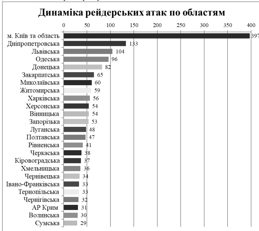
Рис. 3. Динаміка рейдерських атак в Україні по областях, шт. [зроблено авторами на основі [11]]

За даними Генеральної прокуратури України, найчастіше рейдерські захоплення відбуваються в Києві та Київській області. За останні 5 років там було зареєстровано 397 атак. На другому місці – Дніпропетровська (133) та Львівська (104) області (рис. 3).