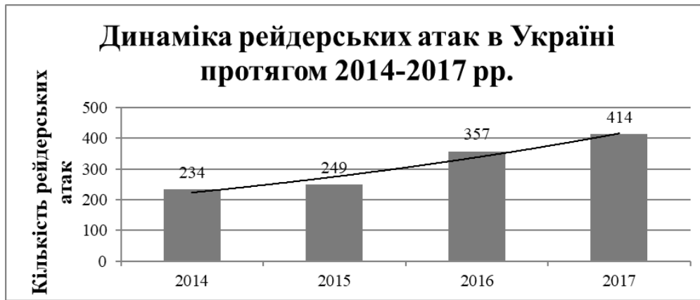
Рис. 2. Динаміка рейдерських атак в Україні 2014-2017 рр., шт. [зроблено авторами на основі [9]]

Згідно наведених даних, менше 1 % справ направляються до суду, а більшість закривається за відсутністю складу кримінального правопорушення. Правоохоронці намагаються уникати розслідування господарських справ, тому більшість випадків рейдерства переходить у господарську юрисдикцію. Це говорить про некваліфіковану роботу сторони обвинувачення по збору доказів, коли адвокати рейдерів успішно