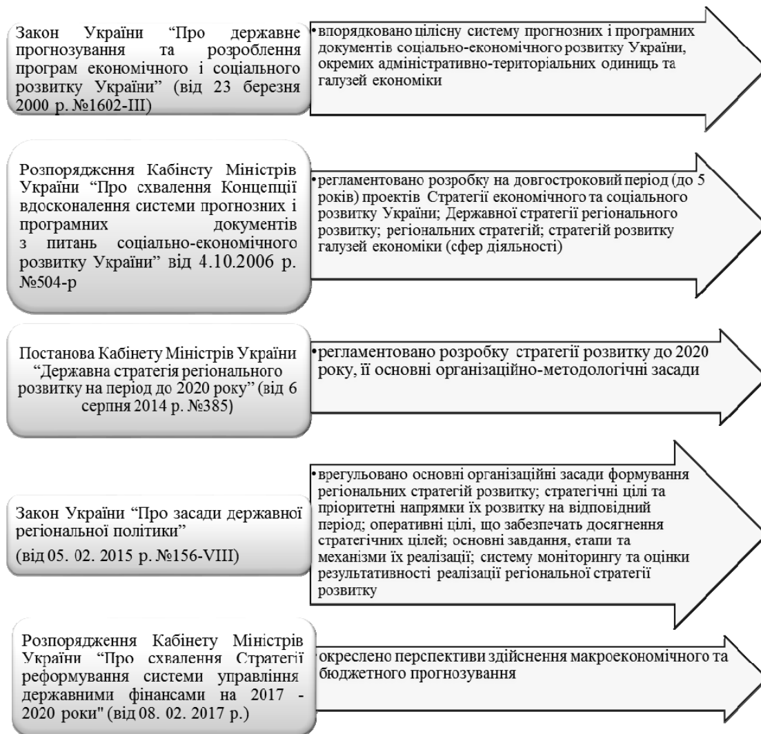
Рис. 1. Розвиток нормативно-правового забезпечення здійснення стратегічного планування [складено на основі [2-6]]

Основні методологічні засади та етапи впровадження програмно-цільового методу передбачено ще з 2002 року Концепцією застосування програмно-цільового методу у бюджетному процесі, де необхідним елементом визначено середньострокове бюджетне планування, обґрунтовано його доцільність, що забезпечить взаємозв'язок стратегічних планів діяльності із реальними бюджетними ресурсами на довгостроковий період [7].