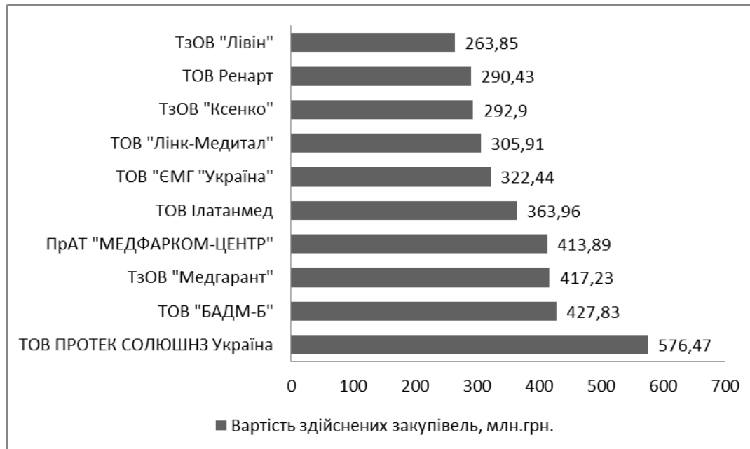
Рис. 3. Рейтинг учасників державних закупівель у сфері охорони здоров'я за період 2016–2017 рр. [побудовано на основі даних [2]]

На ринку державних закупівель є свої компанії-монополісти (рис 3.), які здійснюють найбільшу кількість закупівельних процедур. Якщо аналізувати топ-3 компанії з цього списку, то вони є постачальниками в основному фармацевтичної продукції – 129,28 млн. грн. і лише 4,51 млн. грн. – медичного обладнання.