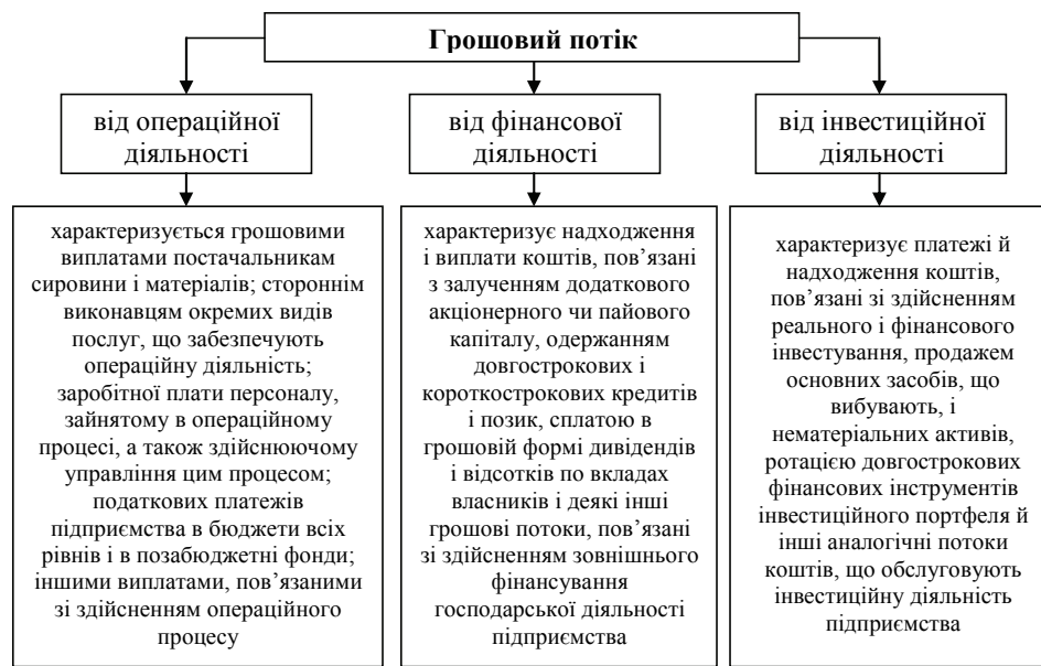
Рис. 1. Види грошових потоків підприємства