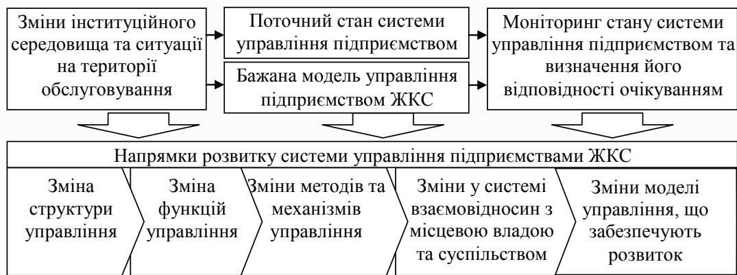
Рис. 3. Основні складові процесу управління розвитком підприємств ЖКС [складено автором]