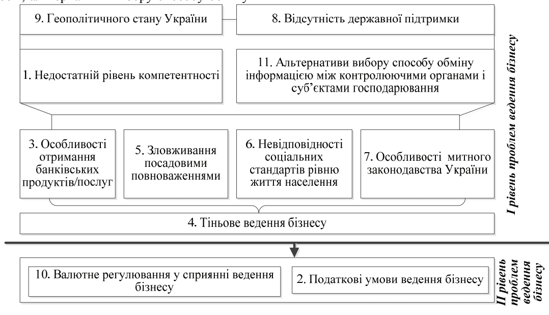
Рис. 2. Ієрархічно структурований граф проблем ведення бізнесу в Україні

формацією між контролюючими органами і суб'єктами господарювання), соціальних (невідповідність соціальних стандартів рівню життя населення, зловживання посадовими повноваженнями), нормотворчих (проблема митного законодавства України проблема особливостей отримання банківських продуктів / послуг) проблем та наявного тіньового сектору ведення бізнесу в неефективне управління та складні податково-валютні умови ведення бізнесу в Україні.