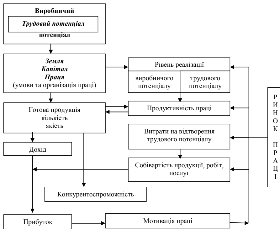
Рис. 3. Взаємозв'язок виробничого потенціалу з конкурентоспроможністю фермерського господарства через відтворення трудового потенціалу [власна розробка автора]