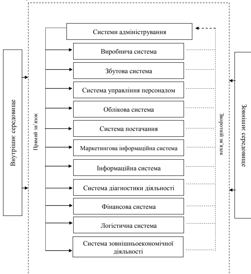
Рис. 1. Зв'язок систем адміністрування із іншими системами суб'єкта господарювання [побудовано автором]

– забезпечення діяльності систем адміністрування (за умови тактичного горизонту планування та традиційних завдань, які ставляться перед системами).