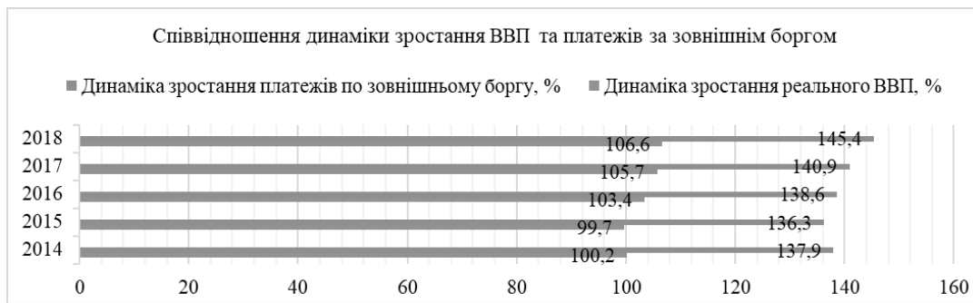
Рис. 3. Співвідношення темпів приросту ВВП і платежів за зовнішнім державним боргом, % [складено автором на основі [9]]

Критичний аналіз результатів дослідження впливу обсягів та структури державних боргових зобов'язань на загальноекономічне зростання держави показав, що боргове навантаження є значним та має тенденцію до зростання. Як наслідок, це стає причиною залежності в майбутньому продовжувати виплачувати й погашати зовнішні валові запозичення. Важливим є те, що ця негативна тенденція забирає з державного бюджету грошові активи, які б позитивно послугували для фінансування перспективних та високодохідних проектів. При швидкому зростанні платежів за зовнішнім державним боргом, у залежності чи є вони меншими за середній темп зростання економіки, чи дорівнюють, немає сенсу у збільшенні оподаткування для населення, адже дохід бюджету покриватиме усі виплати. За таких обставин боргове фінансування дефіциту бюджету позитивно впливає на економічний розвиток і державний бюджет не переобтяжується. В Україні, починаючи з 2014 р., платежі за зовнішнім державним боргом значно перевищували темпи зростання реального ВВП (за винятком 2015 р.).