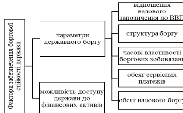
Рис. 1. Фактори забезпечення боргової стійкості держави [складено автором на основі [1]]

Забезпечення урівноваженості грошової системи від негативних впливів, що стосуються причин формування нових боргових запозичень та стабілізації боргових навантажень у межах незмінності, є основною метою боргової політики держави.