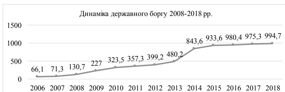
Рис. 4. Динаміка державного боргу протягом 2006-2018 рр., млрд грн. [складено автором на основі [9]]

8. У випадку, коли в країні дуже великий зовнішній та/або внутрішній державний борг їй може бути оголошено дефолт [10]. Відобразимо динаміку державного боргу України (рис. 4).