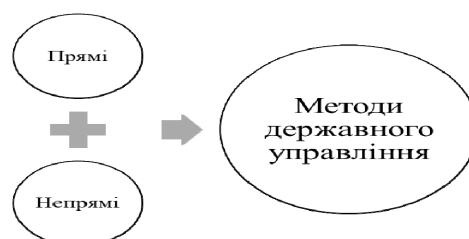
Рис. 2. Методи державного управління державно-приватним партнерством для залучення інвестицій та інновацій [виокремлено авторами]

Стратегія і тактика розвитку державно-приватного партнерства для залучення інвестицій та інновацій надалі визначають відповідну політику розвитку такого партнерства. Така політика, своєю чергою, визначає методи державного управління у зазначеній сфері прямого і непрямого характеру (рис. 2).