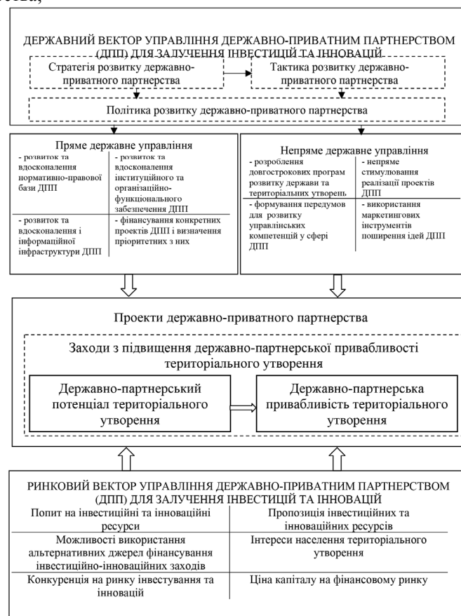
Рис. 3. Модель залучення інвестицій та інновацій на засадах державно-приватного партнерства [побудовано авторами]

На основі вищенаведеного є можливим запропонувати модель залучення інвестицій та інновацій на засадах державно-приватного партнерства, що поєднує державний та ринковий вектори (рис. 3).