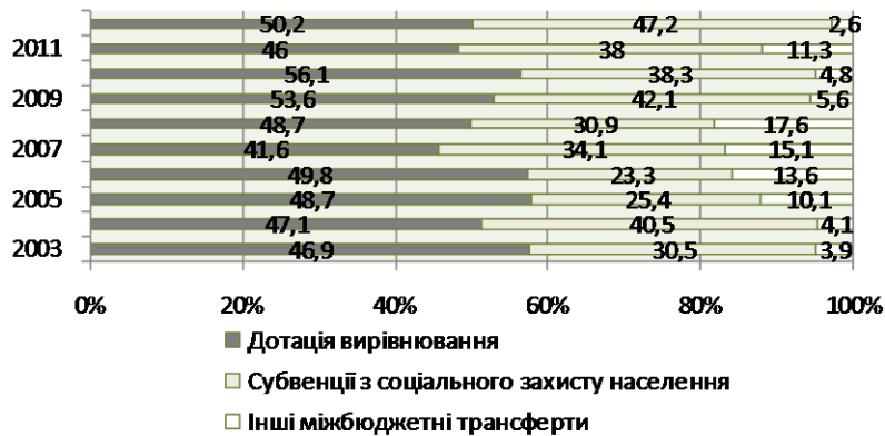
Рис. 2.9 Структура міжбюджетних трансфертів за основними напрямками у 2003 - 2012 років [5,6].

Суттєвого значення з кожним роком набувають також субвенції соціального значення, оскільки найбільша питома вага в загальному обсязі витрат місцевих бюджетів припадає саме на реалізацію соціальних програм (соціальний захист і соціальне забезпечення, освіти та охорону здоров'я). У 2012 році вони становили 47%. Виходячи з даних, наведених на рис. 2.9, можна зробити висновки, що сьогодні в Україні перевага надається поточним (короткостроковим), а не капітальним (цільовим) трансфертам.