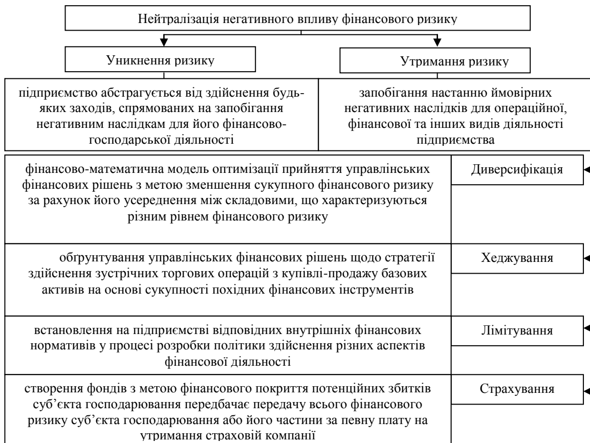
Рис. 2. Схема форм і методів управління фінансовими ризиками сільськогосподарських підприємств

Управління фінансовими ризиками дає можливість раціонально використовувати ресурси, розподіляти відповідальність, покращувати результати діяльності підприємства та забезпечувати прийнятний рівень ризику [5]. При забезпеченні нейтралізації фінансових ризиків суб'єкти господарювання можуть використовувати стратегію уникнення ризику та стратегію утримання ризику (рис. 2).