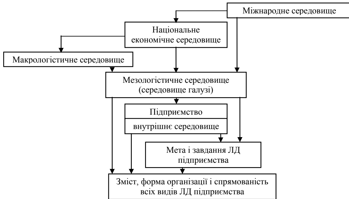
Рис. 3. Схема формування впливу внутрішнього і зовнішнього середовища на ЛД підприємства

1) обґрунтованого встановлення переліку чинників, що мають суттєвий вплив на ЛД підприємств;