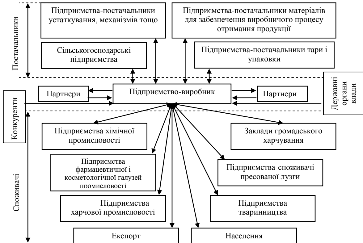
Рис. 2. Аналогова модель зв'язків підприємства олійно-жирової галузі з постачальниками і споживачами

Зовнішнє середовище функціонування зазначених підприємств має доволі складну структуру, яка поділяється на п'ять рівнів. Перший рівень вважають безпосереднім середовищем функціонування підприємства. Дане середовище формується, перш за все, особливостями галузі й обумовлює межу функціонування, склад та структуру управління ЛС кожного підприємства, яка створена відповідно до умов його господарювання в обраному сегменті ринку (рис. 1). У свою чергу, функціональні можливості ЛС, як продуцента одного із основних видів ГД – логістичної, формуються мережею закупівель, розподілу і збуту продукції, яка створюється безпосередньо із потенційного кола постачальників сировини і матеріалів, споживачів, а також можливих партнерів, прямих конкурентів і впливу з боку міських та державних органів влади (рис. 2).