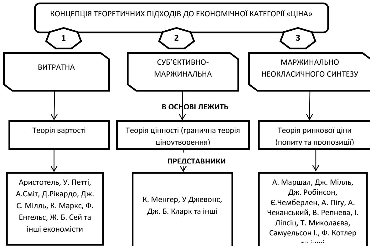
Рис. 1. Концепція та представник теоретичних підходів до економічної категорії «ціна» [розробка авторів]

В. Петті, що був представником класичної школи, яка виникла у XVII ст. в Англії. В. Петті називає вартість «природною ціною». Природну ціну товару, або його вартість, визначають кількістю праці, витраченої на його виробництво. В. Петті у своїх судженнях не розрізняв вартості і мінової вартості, зводячи її до грошей, тому із самого початку не відрізняв вартість від ціни [1, с.45]. У розвиток теорії вартості А. Сміт зробив значний внесок. На відміну від В. Петті, він визнавав працю основною субстанцією вартості – «її дійсним мірилом».