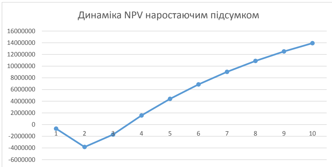
Рис. 3 Динаміка NPV наростаючим підсумком

На рис. 3 представлена динаміка NPV наростаючим підсумком