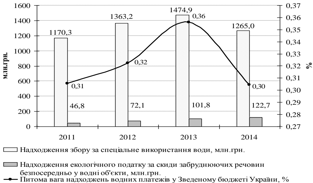
Рис. 2. Динаміка надходжень водних платежів до Зведеного бюджету України за 2011 – 2014 роки [6]

Накопичення водних платежів на рахунках державного та місцевих бюджетів передбачене для реалізації проектів з підтримання розвитку водної галузі, однак, через відсутність достатнього обсягу цих коштів, ця функція виконується лише частково. Розмір накопичення платежів за спеціальне використання водних ресурсів за 2011–2014 роки коливається в межах 1,2–1,5 млрд.грн. – близько 0,3% Зведеного бюджету України (рис.2.).