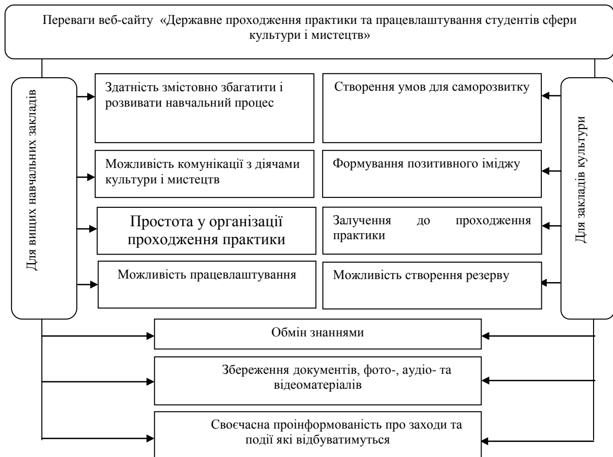
Рис. 3. Переваги діяльності державного веб-сайту для вищих навчальних закладів сфери культури та мистецтв та закладів культури

Щоб запропонований веб-сайт реалізував активну інтернет-комунікацію, необхідно проінформувати керівників ВНЗ, студентів, керівників та працівників закладів культури про основну діяльність сайту шляхом рекламного оголошення. Найдієвішим видом реклами у цьому контексті може бути систематична телевізійна реклама, яка стане ефективним засобом популяризації веб-сайту, адже залишається максимально дієвою завдяки масштабу аудиторії [9, с. 419–437]. Щоб досягти ефективного рівня рекламної дії, необхідно забезпечити зв'язок між державою і суспільством, сформувані рекламне оголошення на основі певних психологічних механізмів, ціннісних понять, соціальних установок, створюючи певний імідж і соціальну значущість діяльності закладів сфери культури і мистецтв. Проте, даний вид реклами може бути використаний на першочерговому етапі. Надалі, щоб рекламне звернення передавало додаткову інформацію необхідно працювати лише з потенційною цільовою аудиторією, нагадуючи їм про веб-сайт з різних сайтів-партнерів або особистими інформаційними листами. Отже, використання веб-сайту «Державне проходження практики та працевлаштування студентів сфери культури і мистецтв» значно підвищить ефективність роботи основних учасників процесу – студентів і працівників закладів культури (рис. 3).