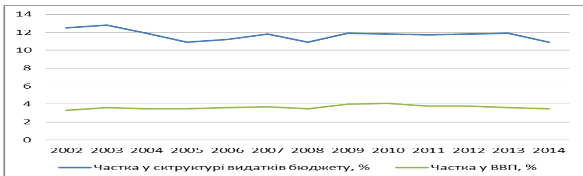
Рис. 1. Питома вага видатків на охорону здоров'я у видатках зведеного бюджету України у 2002-2014 роках*

Якщо проаналізувати структуру видатків зведеного бюджету в Україні, можна чітко прослідкувати високу частку фінансування саме сфери охорони здоров'я (рис. 1).