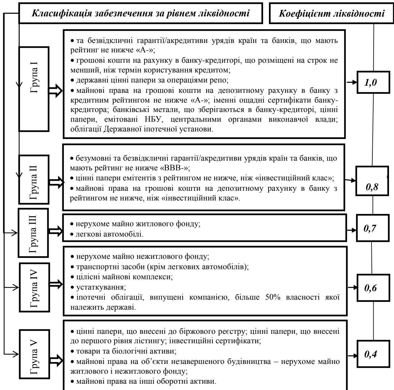
Рис. 3. Класифікація забезпечень за рівнем ліквідності

Висновки. За результатами опрацювання нормативних актів НБУ систематизовано методику формування резервів за кредитними операціями банків. Виокремлено чотири етапи розрахунку ризику кредиту, що надається суб'єкту господарювання: оцінка фінансового стану боржника, оцінка стану обслуговування боргу, визначення категорії якості кредиту та визначення фактичного значення ризику кредиту. Наведено класифікацію активів, що надаються в якості забезпечення кредитів та зменшують суму резерву до формування. Отримані результати слугують базою для розрахунків сум резервів за знеціненими кредитами, що будуть представлені в наступних публікаціях.