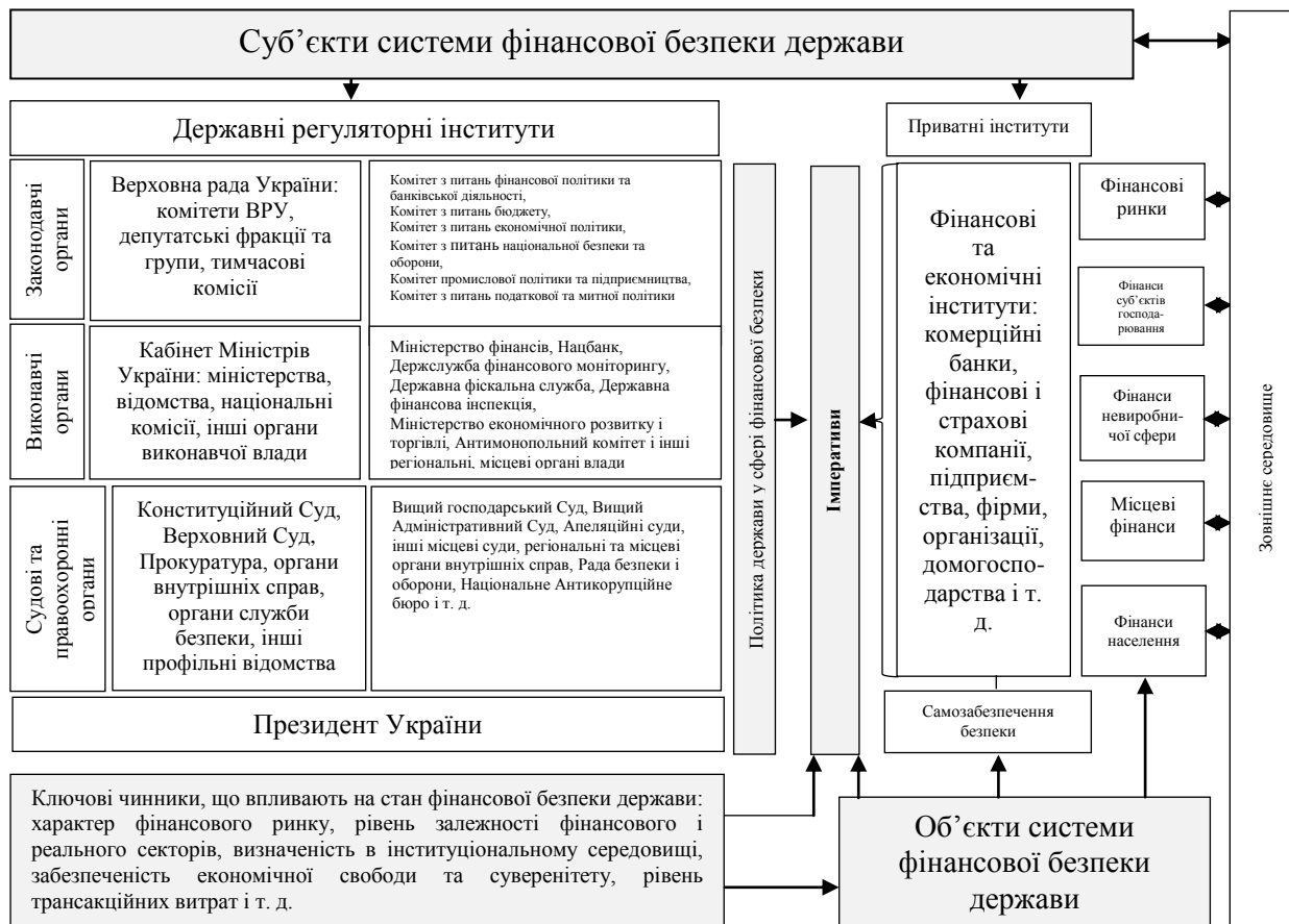
Рис. 1.1. Система фінансової безпеки держави

Імперативи безпеки в свою чергу є сукупністю детермінант, сформованих шляхом взаємовпливів ефективної регуляторної політики державних інституційних структур та інституціонального середовища в процесі розвитку, котрі забезпечують збалансування окремих складових та загалом ефективне функціонування фінансово-економічної та соціальної систем, так як формуються в результаті впровадження прийнятних для даного суспільства норм, тобто на базі традиційних «правил гри» з урахуванням притаманних йому морально-етичних законів і характерних форм фінансово-економічних відносин.