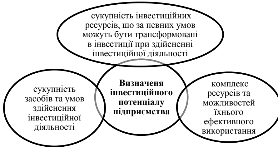
Рис. 1. Визначення інвестиційного потенціалу підприємства

В різній науковій літературі існує декілька понять інвестиційного потенціалу, зокрема Щербатюк О. М виділяє декілька визначень цього поняття [1].