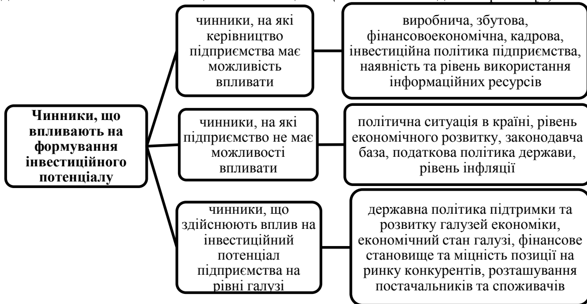
Рис. 2. Чинники, що впливають на формування інвестиційного потенціалу

Формування інвестиційного потенціалу повинно здійснюватися з врахування чинників, що впливають на нього. Такі чинники об'єднуються в групи, зокрема ті, на які керівники підприємств можуть і не можуть впливати та ті, що безпосередньо здійснюють вплив на інвестиційний потенціал. Ці чинники наведені на рис. 2 [2, с. 103].