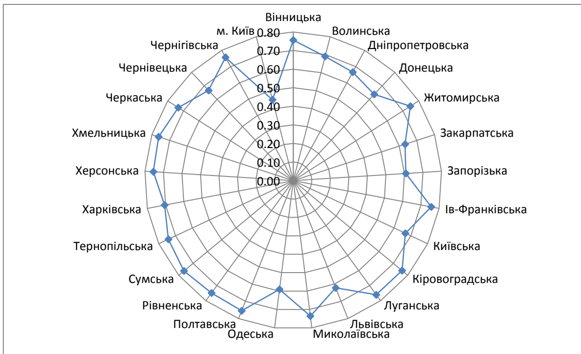
Рис. 2. Відповідність галузевої структури економіки регіонів еталонній постіндустріальному типу (за коефіцієнтом Хечмена)

Як засвідчують розрахунки, у найбільшій мірі відстає від оптимальної (еталонної) частка фінансової сфери, яка становить в середньому по регіонах України біля 2 %, тоді як лише в місті Київ – 6,3 %. Така ситуація зумовлена високими відсотковими