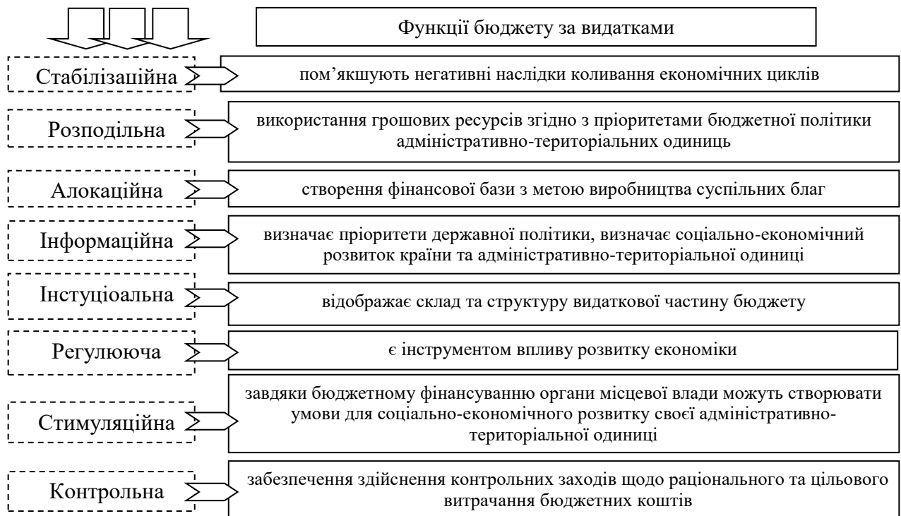
Рис.2. Зміст основних функцій видатків місцевих бюджетів*