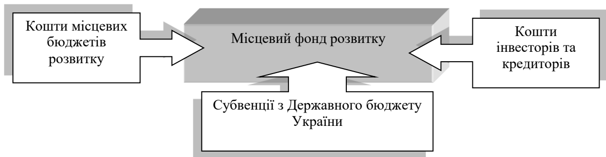
Рис. 3. Структура формування ресурсів місцевого фонду розвитку

На наш погляд, одним із можливих варіантів вирішення зазначених проблем може бути створення фонду розвитку, який би формувався насамперед на основі бюджетних коштів та мав на меті сприяння реалізації інвестиційної політики (при цьому потрібна окрема програма заохочення для таких інвесторів, що включає податкові пільги чи інші інструменти). Такий фонд має бути створений на основі принципів цільового використання, прибутковості та інших, виходячи з чого можна стверджувати, що вперше використання бюджетних коштів буде передбачати не тільки соціальну орієнтацію, а й певний рівень прибутковості. Структура формування місцевого фонду розвитку представлена на рисунку 3.