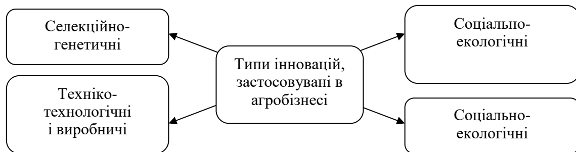
Рис. 1. Типи інновацій по предмету і сфері застосування в агробізнесі [узагальнено на основі ]

По предмету і сфері застосування в агробізнесі можна виділити чотири основні типи інновацій, що сприяють інноваційного процесу (рис. 1).