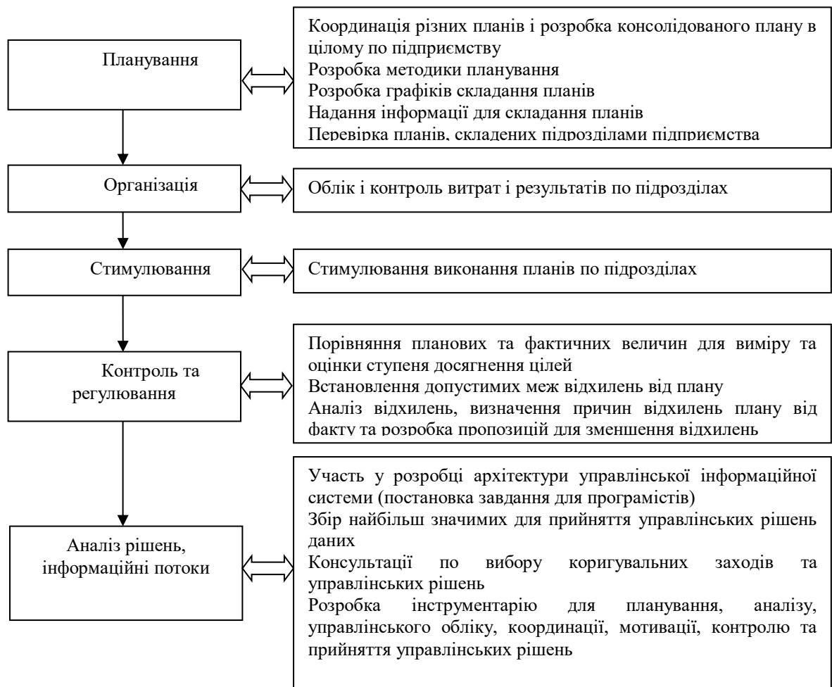
Рис. 1. Місце управлінського контролю в процесі управління підприємством

Контроль взаємопов'язаний з управлінською діяльністю, а тому передбачає високий рівень влади і повноважень для прийняття ефективних управлінських рішень.