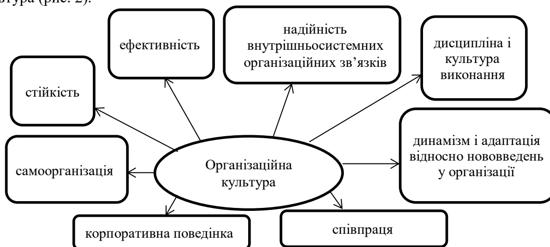
Рис. 2. Фактори діяльності підприємства, на які впливає організаційна культура [сформовано на основі 10, с. 724]

Визначимо коло факторів, на які здійснює вплив ефективна організаційна культура (рис. 2).