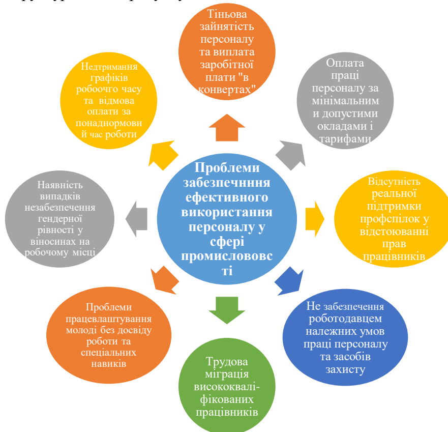
Рис. 1. Основні проблеми забезпечення ефективного використання персоналу у сфері промисловості (розроблено автором)

Виклад основного матеріалу дослідження з повним обґрунтуванням отриманих результатів. На основі аналізу сучасної практики функціонування сфери промисловості на національному та регіональному рівнях, а також діяльності окремих суб'єктів господарювання різного рівня можна виділити ряд ключових проблем, які перешкоджають ефективному використанню персоналу у цій галузі. У загальному вигляді вони структуровані на рисунку 1.