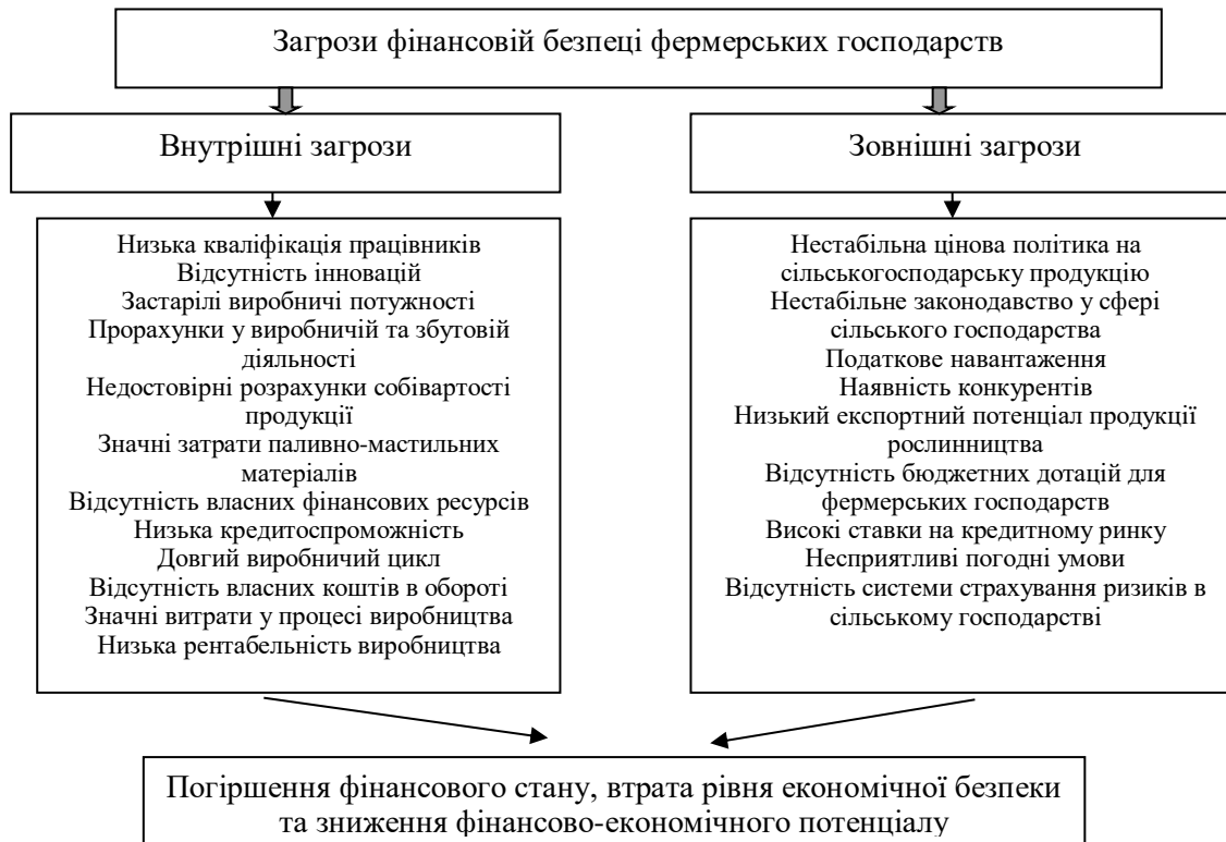
Рис. 1. Загрози фінансовій безпеці фермерських господарств*

Зважаючи на вище зазначене, можна свідчити про наявність різноманітних підходів до виокремлення факторів та загроз зміни рівня фінансової безпеки підприємств. Адаптуючи дані вивчення до діяльності сільськогосподарських підприємств, можна подати власну класифікацію загроз рівню фінансової безпеки фермерських господарств. У процесі формування комплексу загроз втрати фінансової безпеки фермерських господарств, варто дослідити усі зовнішні фактори, притаманні лише для даних суб'єктів господарювання. У цьому аспекті необхідно звернути увагу на природно-кліматичні умови, законодавчі обмеження, експортний потенціал галузі, цінову політику та наявність конкурентів. На рисунку 1 відображено загрози зниження рівня фінансової безпеки фермерських господарств, які окрім цього можна вважати факторами впливу на її зміну.