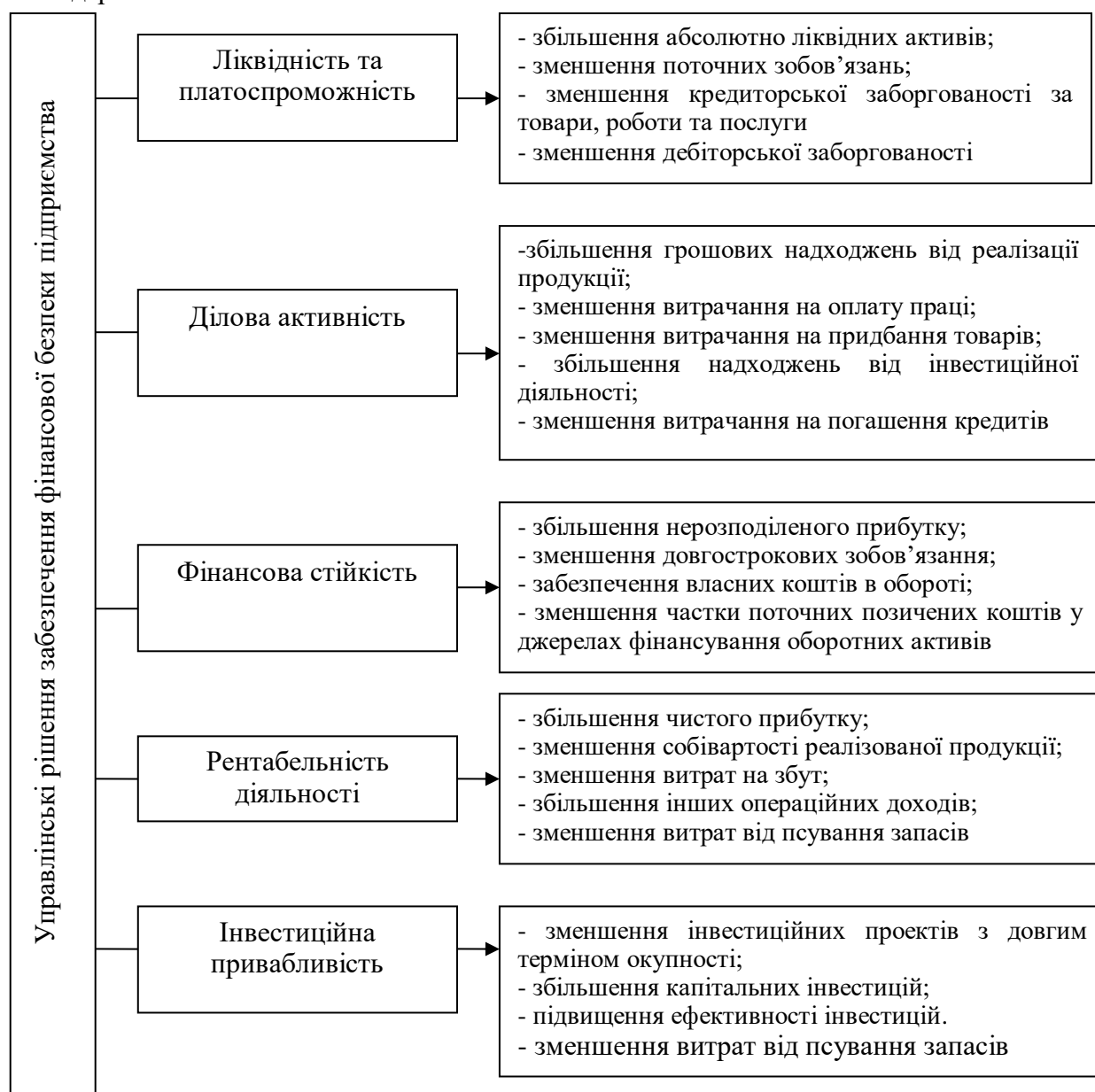
Рис. 3. Напрями управління фінансовою безпекою фермерських господарств*

управлінську діяльність за такими напрямками: ліквідність і платоспроможність, ділова активність, рентабельність, фінансова стійкість та інвестиційна привабливість. На рисунку 3 відображено напрями управління фінансовою безпекою фермерських господарств.