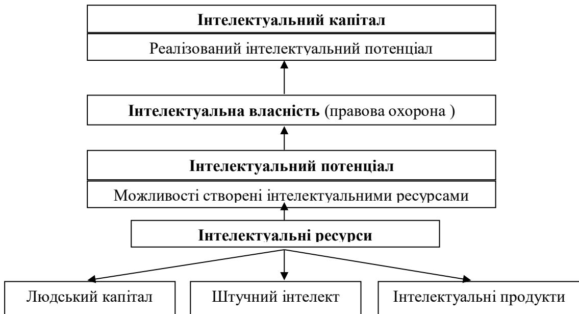
Рис. 4. Інтелектуальний капітал як реалізований інтелектуальний потенціал (удосконалено авторами на основі [13]).

Визначальна особливість інтелектуального капіталу полягає у тому, що ним володіє не лише підприємець, але й найманий персонал. Інтелектуальний капітал виникає внаслідок взаємодії людей, людей та інформаційних ресурсів, а також людей і елементів фізичного капіталу в процесі виробництва. Він містить у собі все, що знає організація і що дає змогу їй реагувати на зміни ринкової кон'юнктури швидше за конкурентів. Отже, інтелектуальний капітал – це сукупність явних і неявних знань, які організація може перетворити у прибуток [7].