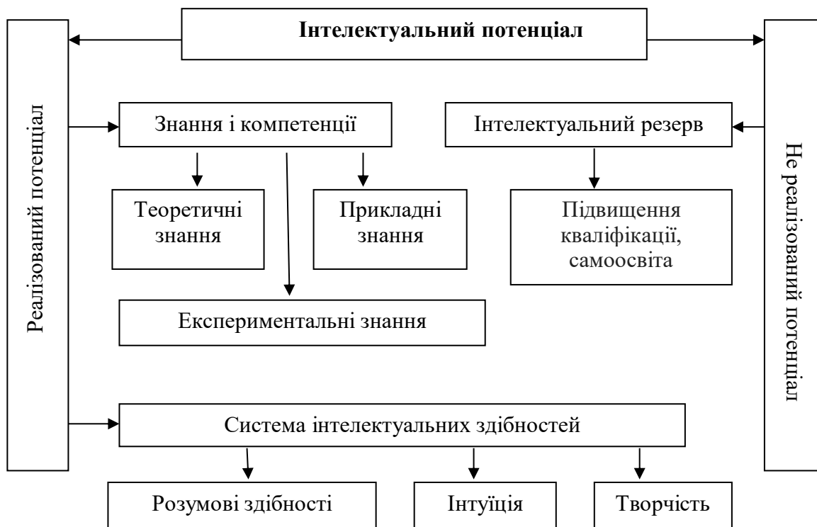
Рис.1. Інтелектуальний потенціал як система знань

Необхідно відмітити (рис. 1), що інтелектуальний потенціал складається з двох частин – реалізованої і нереалізованої: виявлені знання і здібності – це реалізований потенціал, можливі – нереалізований. Знання і здібності, що розвиваються – з одного боку, можна віднести до реалізованого потенціалу, так як розвиток має на увазі часткову реалізацію, а з іншого боку, – до нереалізованого потенціалу, так як розвиток це їх прогрес, який не досяг свого закінчення. Для того, щоб інтелектуальний потенціал розвивався, необхідний перехід можливих знань і здібностей – в розвиваючі, а розвиваючі – у виявлені, тобто перетворення нереалізованого потенціалу в реалізований і формування нового нереалізованого потенціалу [9].