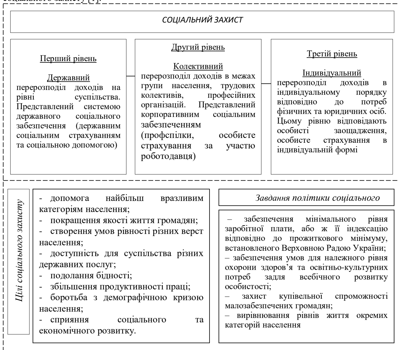
Рис. 1. Системна структура політики соціального захисту

бідних верств населення, подальше реформування сфери надання соціальних послуг і соціального захисту [1].