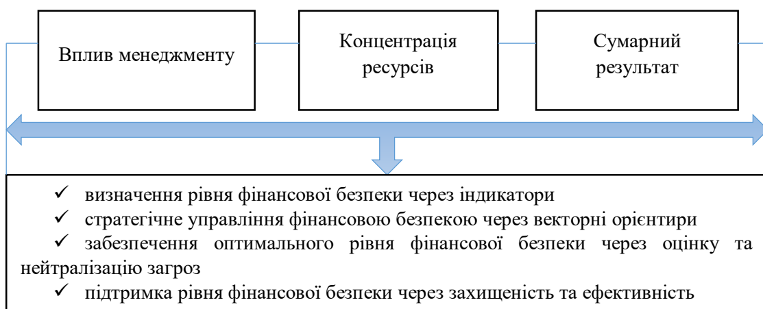
Рис. 1. Концепт системи менеджменту фінансовою безпекою підприємства

Сформуємо теоретико-прикладну систему векторного управління фінансовою безпекою підприємства через групування якісних складників (рис. 1).