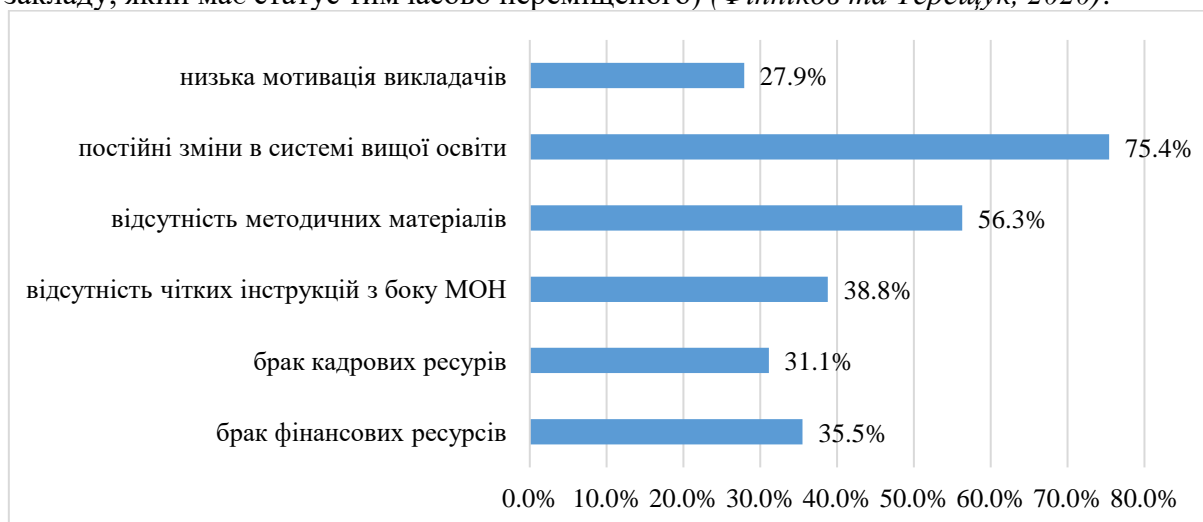
Рис. 1 Труднощі, з якими зіткнулися українські університети у процесі запровадження системи внутрішнього забезпечення якості (Фінніков та Терещук, 2020).

Дослідження сучасного стану галузі вищої освіти, вказують на те, що із 183 опитаних українських університетів у 50-ти наявні сертифікати якості, із них 46 є державними, 3 приватними і 1 комунальний. Якщо ж аналізувати ситуацію у розрізі спеціалізації ЗВО, то найбільш активними виявилися медичні та технічні заклади (сертифікацію пройшли 50% та 45,2% закладів у відповідних категоріях). Натомість лише 14,3 % класичних університетів можуть “похвалитися” пройденою сертифікацією (Фінніков та Терещук, 2020). Більшість університетів, у яких не має сертифікатів пояснює це відсутністю державних або відомчих вимог щодо обов'язковості таких дій. Удвічі менша частина посилається на брак необхідних коштів (рис. 1). Можливість зазначення власної причини, якою скористалися 44 заклади, на жаль, не продемонструвала якихось раціональних пояснень чи причин (за винятком одного закладу, який має статус тимчасово переміщеного) (Фінніков та Терещук, 2020).