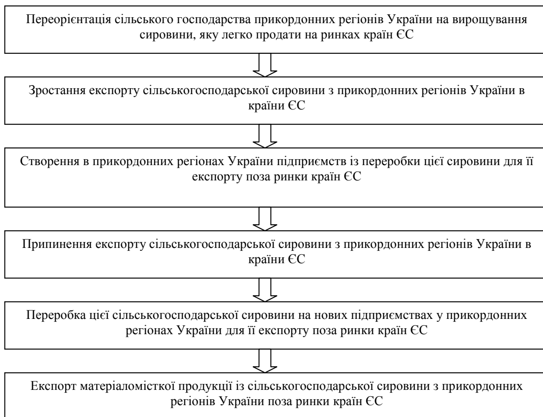
Рис. 1. Очікувані тенденції розвитку ситуації у сфері виробництва та експорту сільськогосподарської сировини й продуктів її переробки

очікувати створення потужностей для перероблення цієї сировини в Україні й експорту продуктів харчової промисловості в інші країни поза ЄС, оскільки квоти безмитного експорту в країни ЄС цієї продукції є незначними, а розміщення підприємств із переробки названих видів сільськогосподарської сировини тяжіє до її джерел – регіонів України, що межують із країнами ЄС. Очікувані тенденції розвитку ситуації у сфері виробництва та експорту сільськогосподарської сировини й продуктів її переробки в прикордонних регіонах України наведено на рис. 1.