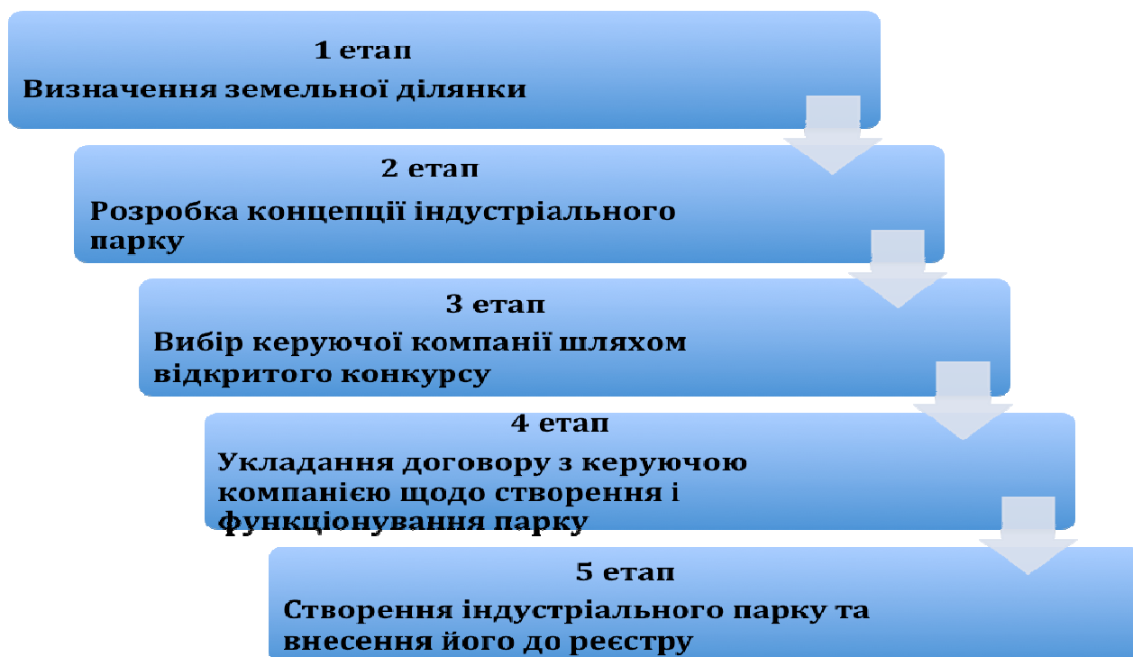
Рис. 1. Організація процесу (етапи) створення індустріальних парків

Учасниками ІП можуть бути суб'єкти господарювання, зареєстровані на території адміністративно-територіальної одиниці України, у межах якої розміщений ІП.