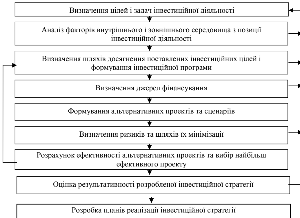
Рис. 2. Процес формування інвестиційної стратегії

Таким чином, нами був обґрунтований склад процесу формування інвестиційної стратегії та з'ясовано його зміст.