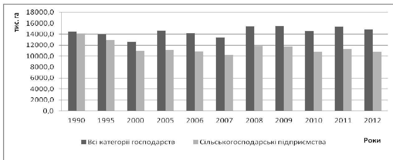
Рис. 1. Площа збирання урожаю зернових і зернобобових культур*

Дані демонструють, що більшу площу, з якої зібрано урожай зернових і зернобобових культур, займають сільськогосподарські підприємства – 10,8 млн. га з 14,8 млн. га загальної площі зернових, або майже 73%, і саме вони є перспективними для розвитку зернового господарства України.