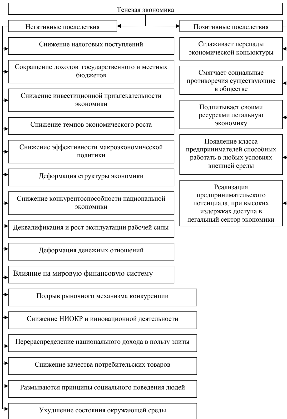
Рис. 1. Положительные и отрицательные последствия влияние теневой экономики на экономику Украины