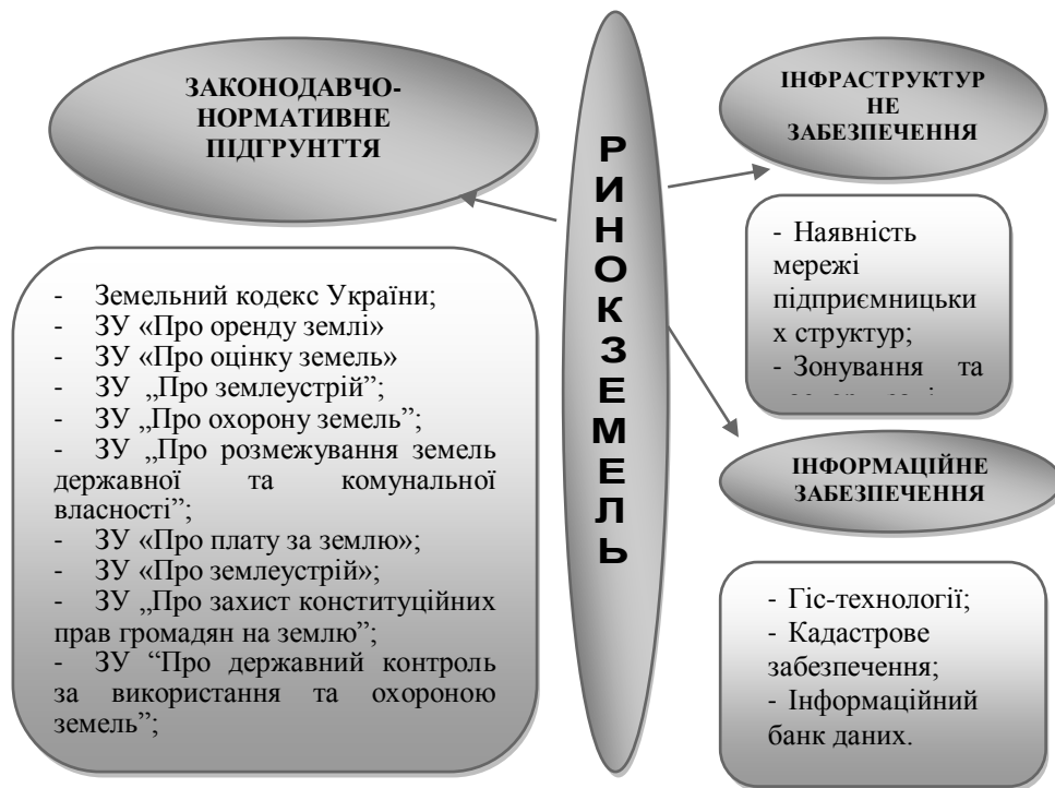
Рис.1 Інституційні важелі регулювання ринку земель в Україні

Земля – це особливий товар і обмежений ресурс, вартість якого з кожним роком тільки зростає, крім того на третину забезпечує поповнення місцевих бюджетів, що сприяє соціально культурному розвитку регіонів.