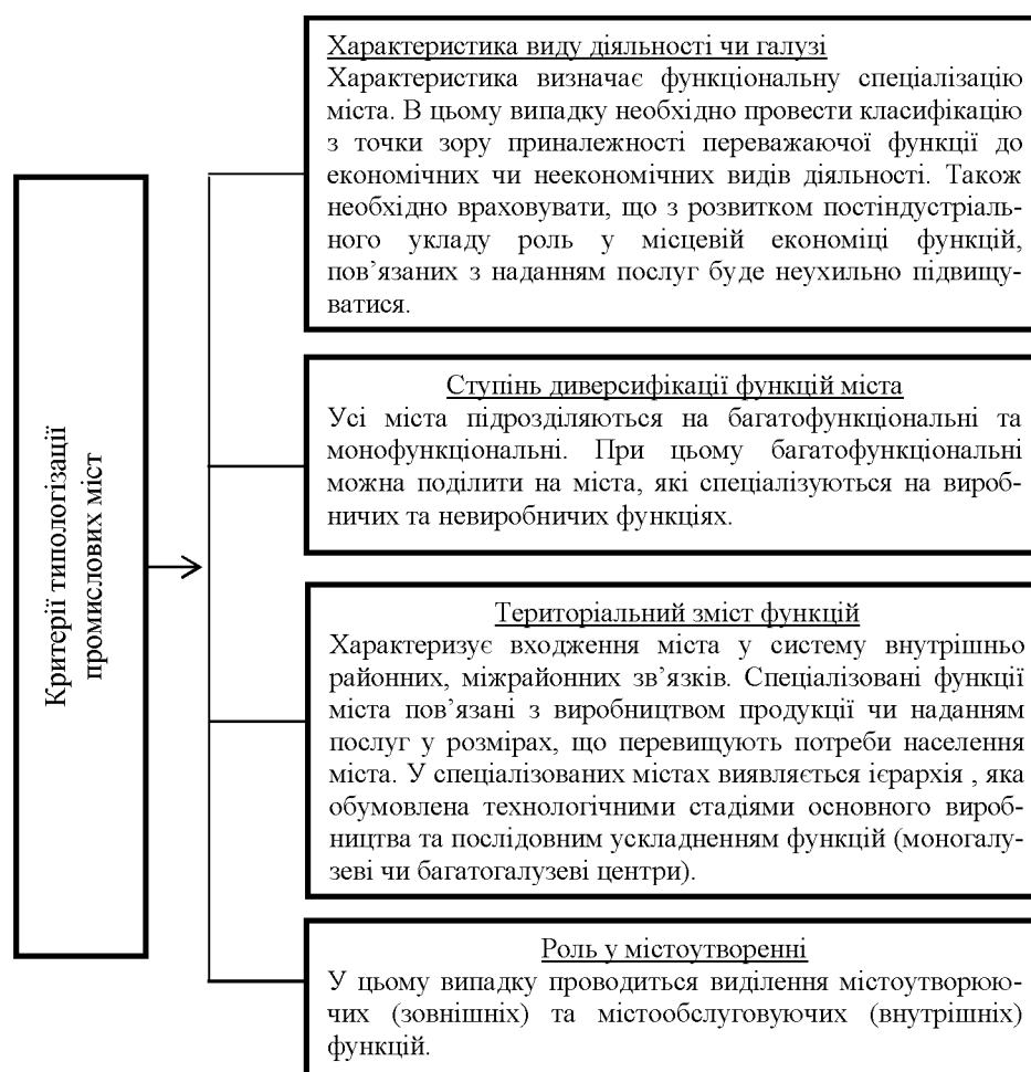
Рис. 1. Критерії типологізації промислових міст

Таким чином, прийняття управлінського рішення про формування функціональної спеціалізації промислового міста стає результатом аналізу комплексу чинників, які визначають потенційне місце та характер взаємозв'язків міста в ієрархії старопромислового регіону, взаємовпливу та взаємодії функцій, що формуються, об'єктивних меж, що визначаються економіко-географічними умовами та чисельністю населення.