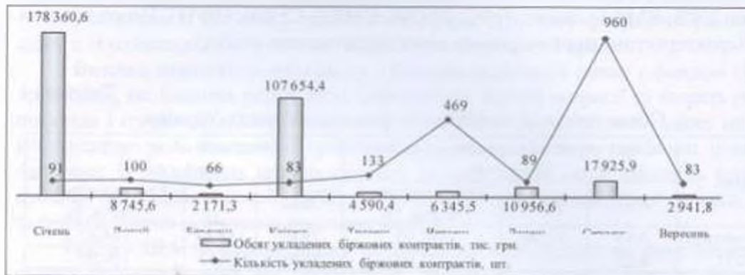
Рис. 2 Динаміка укладання на УФБ біржових контрактів щодо купівлі-продажу фінансових інструментів за 9 міс 2014 р. Джерело [3]

28,19 млрд. грн.). За результатами торгів на організаторах торгівлі, обсяг біржових контрактів (договорів) з цінними паперами у 2013 році становив 264,26 млрд. грн., що більше на 28,42 млрд. грн. у порівнянні з 2011 роком (235,84 млрд. грн.). В Україні з кожним роком потрібно виплачувати все більше коштів за зовнішніми позиками, тому одним із найпростіших способів залучення коштів до загального бюджету країни є продаж державних облігацій. У 2013 році на ринку цінних паперів найбільшою інвестиційною привабливістю характеризувались державні облігації та акції, що відобразилось у обсязі здійснених контрактів. Частка операцій з державними облігаціями зросла з 42,03% у 2012 році до 67,78% у 2013 році.