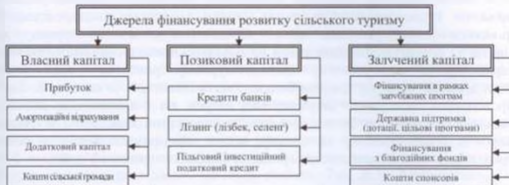
Рис. 2. Джерела фінансування розвитку сільського туризму в Україні (розроблено автором)

Для розвитку та ефективного функціонування сільського туристичного бізнесу в Україні необхідним є його своєчасне та у повному обсязі фінансування. Потенційними джерелами фінансування розвитку сільського туризму можуть бути власні кошти домогосподарств, сільських громад або сільськогосподарських підприємств, у яких одним із видів діяльності є надання послуг з туризму або які планують надавати послуги з туризму. Такими джерелами є: прибуток, кошти додаткового капіталу, амортизаційні відрахування. Але для запровадження у життя масштабних проектів щодо розвитку сільського туризму необхідні значні інвестиції, джерелами таких інвестицій виступають залучені та позикові засоби. Традиційними джерелами позикових коштів виступають кредити банків, пільговий інвестиційний податковий кредит. Доцільно також використовувати інші джерела для фінансування сільського туризму, зокрема: фінансування в рамках зарубіжних програм, фінансування з бюджету, фінансування з благодійних фондів, спонсорство (рис.2).