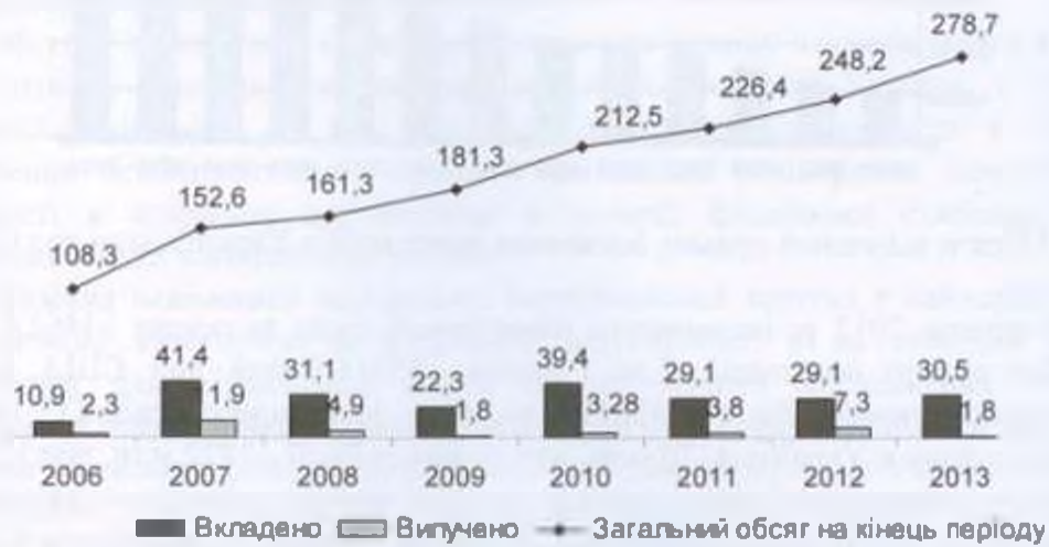
Рис 2. Інвестиції в економіку Вінницької області, млн.дол.США

Загалом, до Вінницької області надійшли інвестиції з 50 країн світу. Найбільш вагомі вкладення здійснені партнерами з Кіпру, Австрії, Франції, Німеччини, Польщі. На ці п'ять країн припадає 73,7% від загального обсягу прямих іноземних інвестицій.