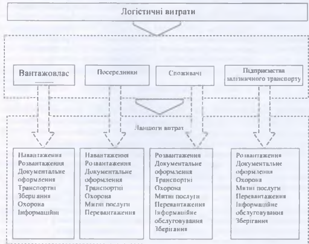
Рис. 3. Логістичні витрати суб'єктів логістичної системи

функцій (операцій), а також втрат, що виникають в наслідок неналежного виконання їх зобов'язань або відхилень від запланованих дій (рис. 3).