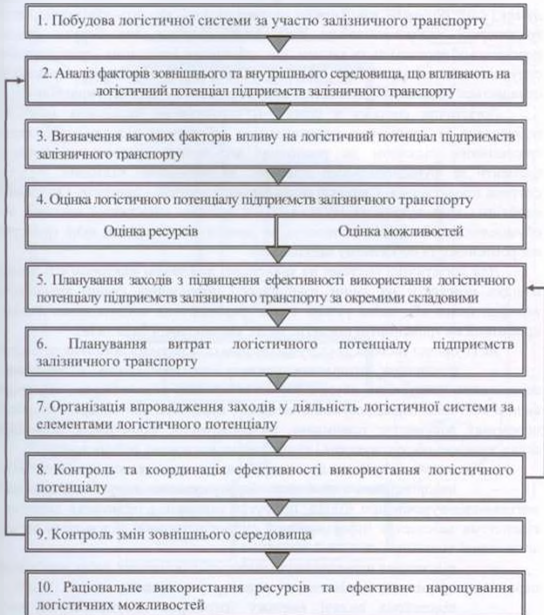
Рис. 1. Послідовність управління логістичним потенціалом підприємств залізничного транспорту

Послідовність управління логістичним потенціалом підприємств залізничного транспорту наведена на рис. 1. В результаті реалізації етапів послідовного управління логістичним потенціалом підприємств залізничного транспорту формується логістична система за участю залізничного транспорту.