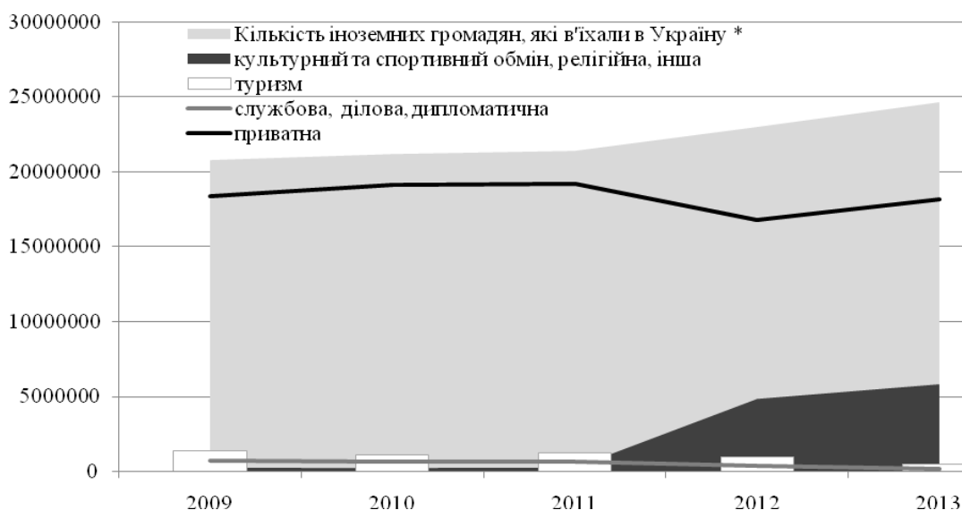
Рис. 2. Динаміка в'їзного потоку іноземних громадян в Україну

Станом на 1 жовтня 2013 р. на обліку в районних податкових інспекціях Головного управління Міндоходів у Києві перебували 273 платники турзбору, з яких 166 – юридичні особи, 107 – особи [5].