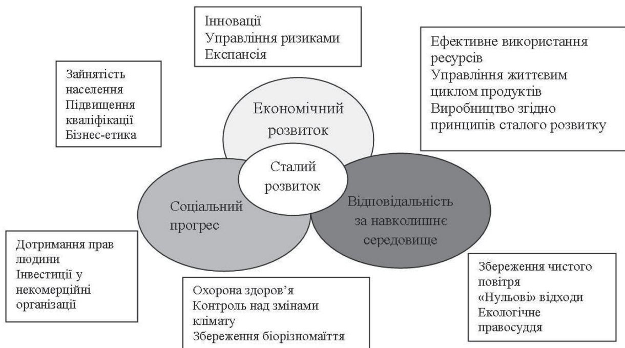
Рис. 2. Сталий розвиток підприємства

Обсяг притягнутих в сферу зв'язку та інформатизації інвестицій становив у 2014 р. 1,86 $ млрд., що на 9,3% менше ніж станом у минулий рік [5, 6]. При цьому, ураховуючи провідну роль розвитку сфери зв'язку та інформатизації в процесі розвитку економіки країни, а також ураховуючи існуючу закономірність пропорційно-випереджального розвитку телекомунікацій стосовно економіки країни (закон Джипа [9]) необхідним становиться перехід цієї сфери до такого типу розвитку, який дозволив забезпечити цей розвиток. Тому, оскільки на сьогодні екстенсивний тип розвитку підприємств недостатньо ефективний, а інтенсивний та інноваційний потребують суттєвих інвестицій, підприємствам доцільно удаватися до концепції сталого розвитку, яка у загальному вигляді наведена на рис. 2.