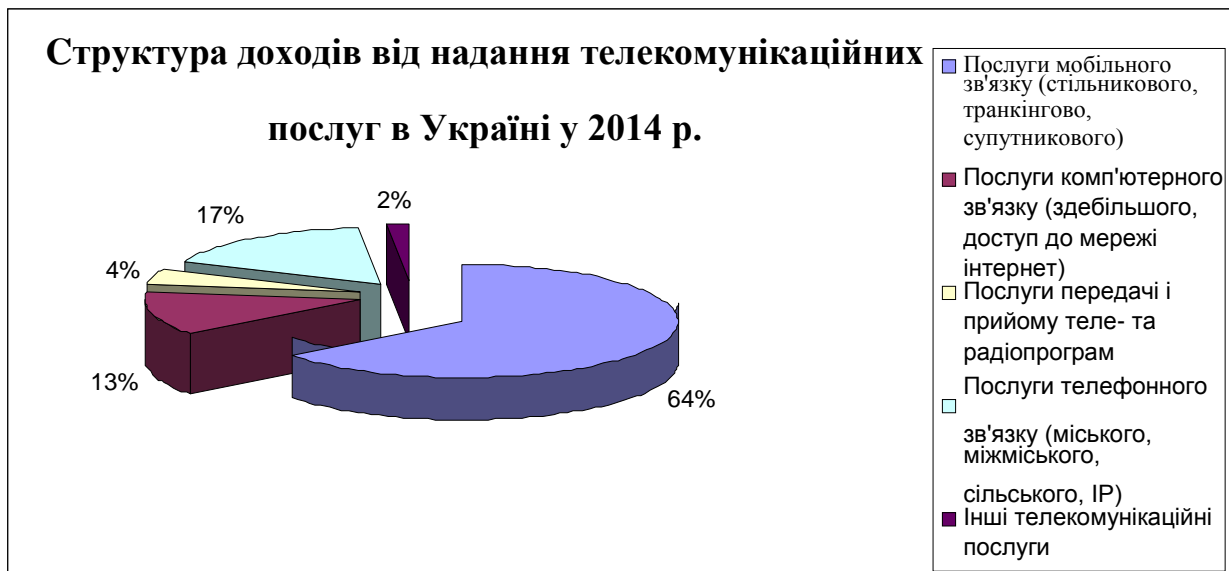
Рис. 2. Структура доходів телекомунікаційних підприємств України у 2014 році (складено автором на основі [10])